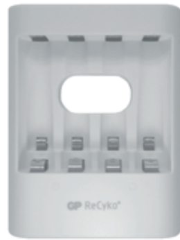
GP PowerBank Charger